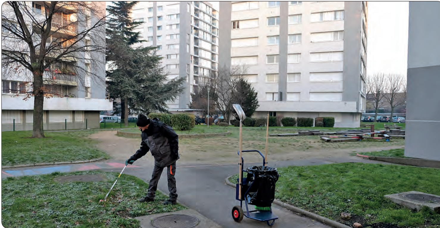
Un agent de la Régie de proximité aux pieds des immeubles de la route de Saint-Leu.

Créée administrativement l'été dernier, la Régie de proximité de Villetaneuse est une association qui a débuté ses activités en décembre 2018 dans le but d'améliorer le cadre de vie des habitants tout en créant de l'activité économique et en œuvrant pour l'insertion professionnelle et sociale.